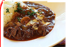
ハッシュド・ビーフ