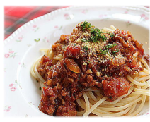
スパゲティミートソース