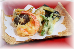
天ぷら・かき揚げ