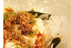
豆腐とじゃこのサラダ