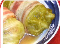
和風ロールキャバツ