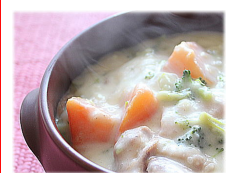
クリームシチュー