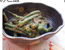
いんげんの胡麻和え