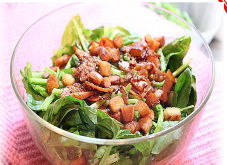
ほうれん草と ベーコンのサラダ