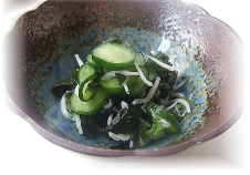
わかめときゅうりの酢の物