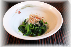
ほうれん草のお浸し