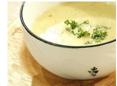
コーンクリームスープ