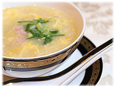
中華風コンソープ