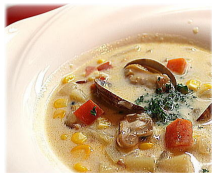
クラムチャウダー