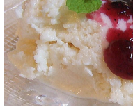
ヨーグルトシャーベット