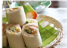
エッグロールサンド