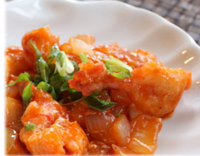
海老のチリソース煮