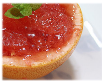
グレープフルーツのゼリー