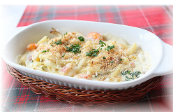
マカロニグラタン