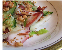
タコときょうりの中華サラダ