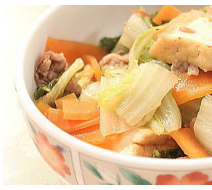
白菜と厚揚げの煮物