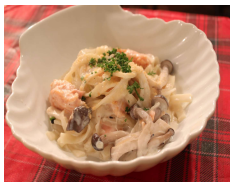
サーモンとキノコの クリームパスタ