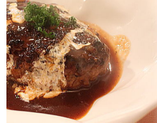
煮込みハンバーグ