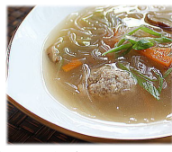
肉団子と春雨のスープ