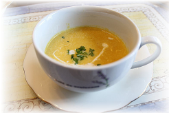
かぼちゃのポターシュ