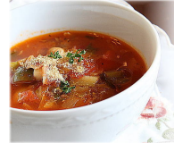
ミネストローネーフ