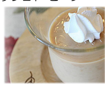
キャラメルミルクプリン