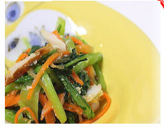
青菜の酢みそ和え